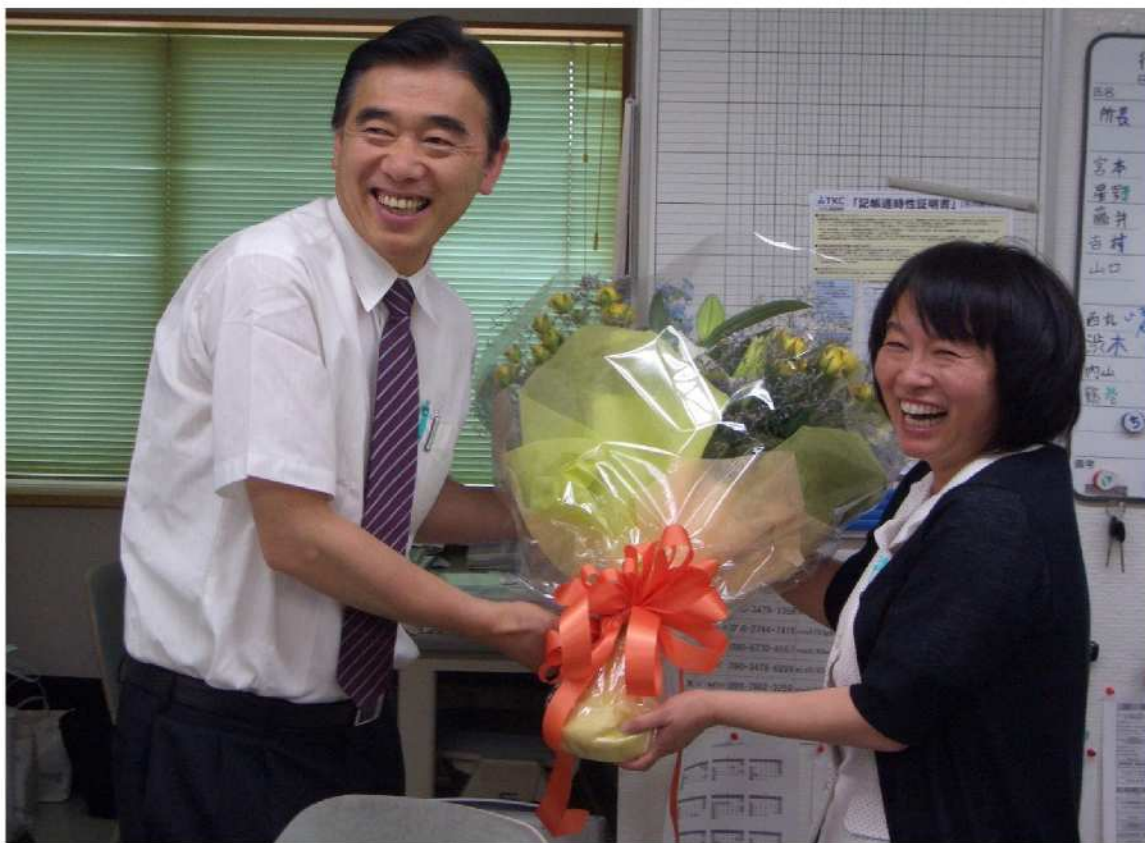
山口所長 53歳のHappy Birthday スタッフより愛を込めて