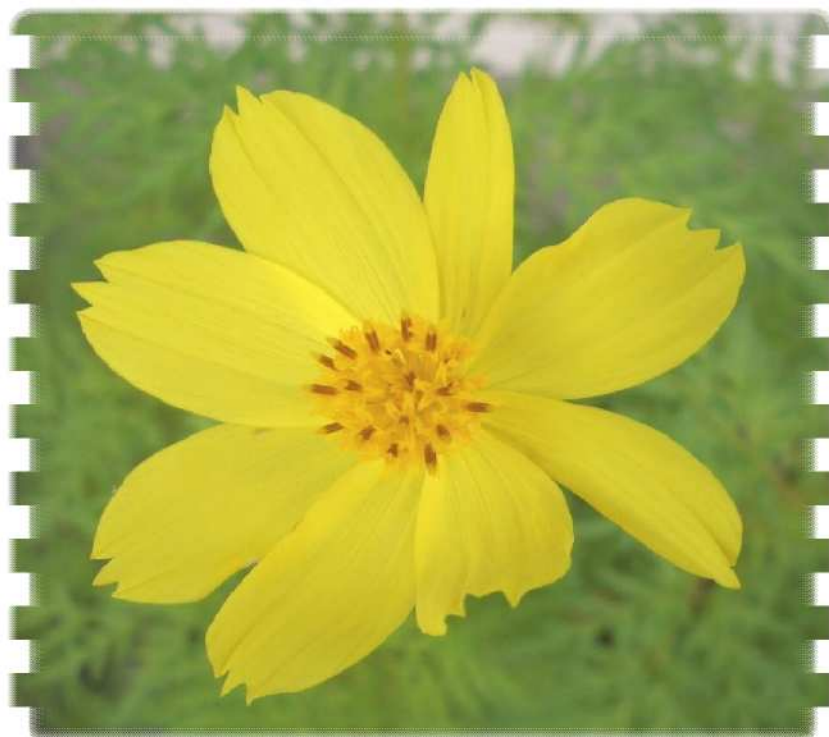
黄花コスモスが咲きました（8/5事務所にて撮影）