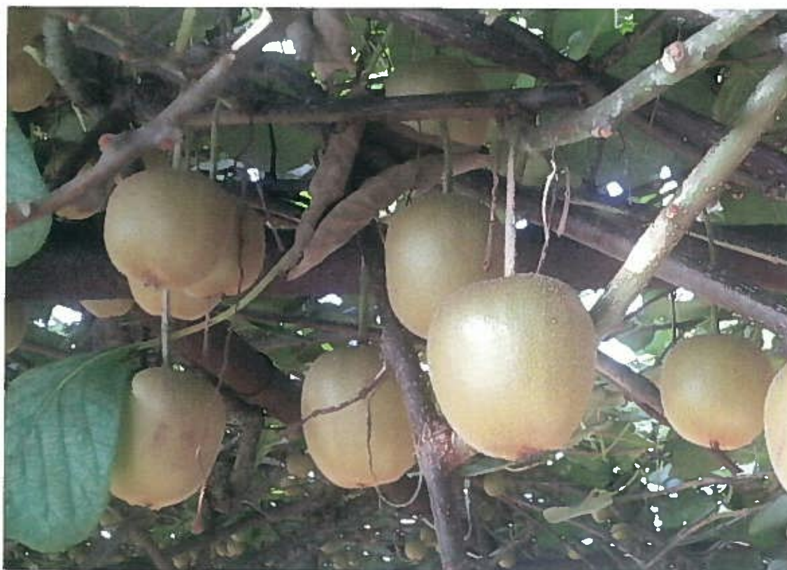
実りの秋。梨のようにも見えますが、キウイです。(宮本邸にて撮影)